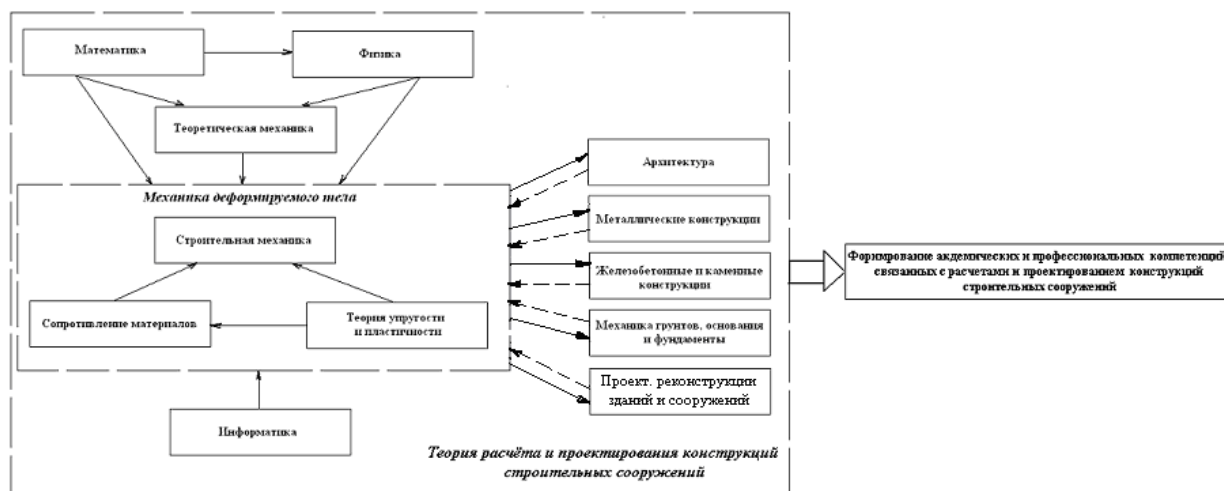
Рисунок 1. – Структурно-логическая схема взаимосвязи строительной механики с дисциплинами учебного плана специальности «Промышленное и гражданское строительство»

Первый уровень структурно-логических схем позволяет студенту увидеть и понять взаимосвязь изучаемой дисциплины с общеобразовательными и специальными дисциплинами учебного плана специальности, на которой студент учится. Пример схемы этого уровня для строительной механики, изучаемой студентами специальности «Промышленное и гражданское строительство» приведен на рисунке 1.